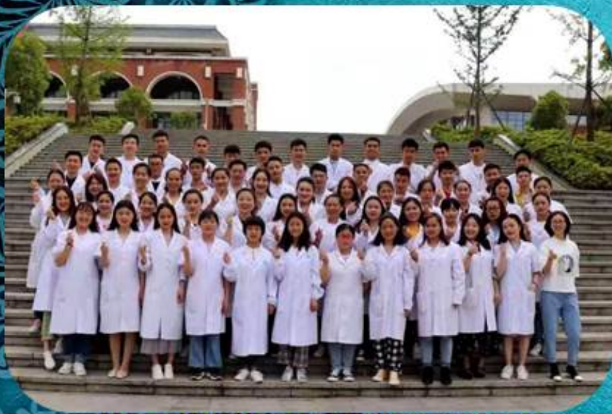
(陳同學與同學們的畢業合照)

您們好，我是一名即將畢業的醫科學生，在這裡想對幫助了我六年的資助人，以及慈福行動的所有同工，送上最誠摯的感謝和祝福。